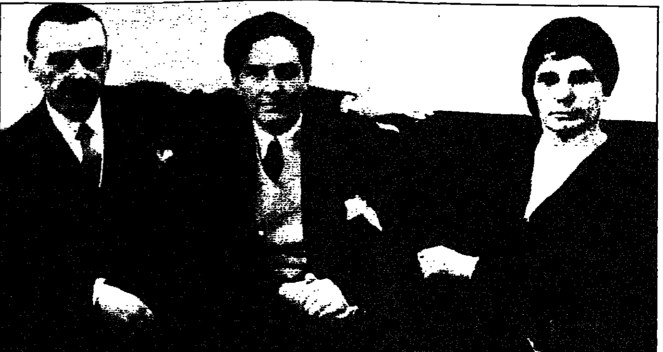
توماس مان في لقطة عائلية